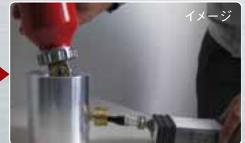
従来の消火器 (水による気密試験)